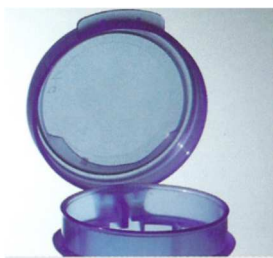
Cape attenante avec lèvre anti-gouttes Hinged cap with anti-drip lip